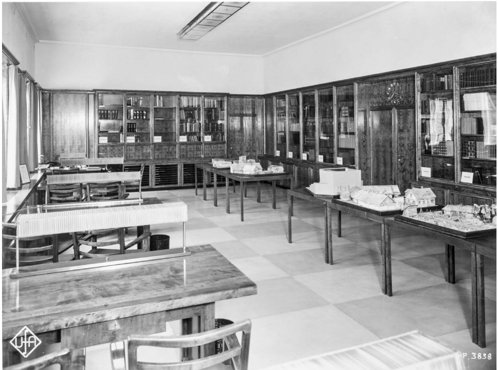
Abb. 3: Blick in die Bücherei der Ufa-Lehrschau, nach 1936.

Vorkommen durch Verweise im erhaltenen Korpus signalisiert wird, lesen zu können (etwa den Eintrag „Kunst“). Doch ist das Fragment mit seinen überlieferten Lemmata auch ohne dies höchst aufschlussreich. Es dokumentiert nicht nur eine zeittypische Perspektive, nicht nur Traubs imponierende Verfügung über alle Aspekte des Phänomens Film, wie sie sich Anfang der 1940er Jahre des vergangenen Jahrhunderts darstellten. Darüber hinaus erlaubt es – insbesondere aufgrund des gänzlich zusammenhängend überlieferten ersten Teils dieses Werks – eine angemessene Einschätzung der Bedeutung des gesamten Publikationsvorhabens. Denn in diesen lückenlos aufeinander folgenden Stichworten und den handschriftlich angemerkten Ergänzungen lassen sich die schiere Fülle und beeindruckende Varietät der Stichworte und damit die Leistung des Autors besonders gut erkennen. Dieser Teil also bietet eine solide, breitgefächerte Grundlage für eine Einschätzung der Stellung des Lexikons im Filmschrifttum der Zeit.