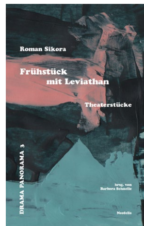
Bd. 3: Roman Sikora: Frühstück mit Leviathan. Theaterstücke hrsg. von Barbara Schnelle (im Erscheinen)

hrsg. von Charlotte Bomy / Lisa Wegener – Vier Theaterautorinnen widmen sich mit großer Lust an der Dekonstruktion Schwarzen Identitäten und afrofeministischen Positionen –