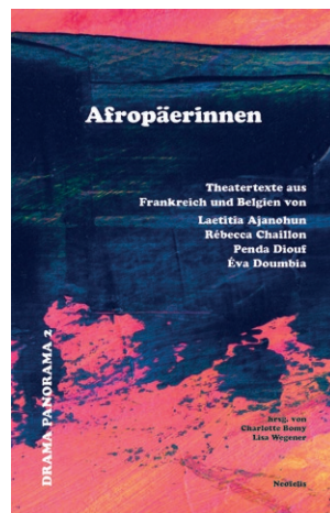
Bd. 2: Afropäerinnen. Theater Texte aus Frankreich und Belgien von Laetitia Ajanobun, Rébecca Chaillon, Penda Diouf und Éva Doumbia

– Neun Theaterstücke aus Tschechien auf der Suche nach theatralen Gegenwartsbildern: grotesk, politisch und aktuell –