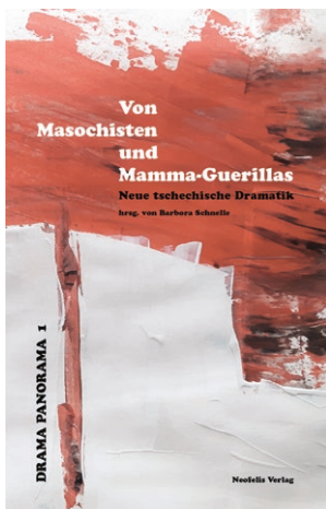
Bd. 1: Von Masochisten und Mamma-Guerillas. Neue tschechische Dramatik hrsg. von Barbara Schnelle

Seit 2018 baut der Neofelis Verlag mit der Reihe seinen Theaterschwerpunkt aus und veröffentlicht sie in Kooperation mit dem Übersetzer*innennetzwerk Drama Panorama e. V.